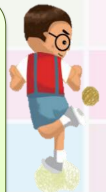
เตะกร้อ 藤球