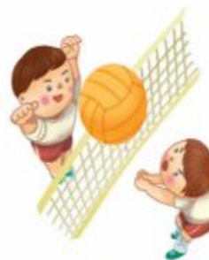
วอลเลย์บอล 排球