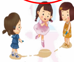
กระโดดเชือก 跳繩