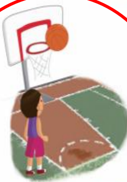
บาสเกตบอล 籃球