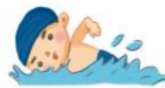
ว่ายน้ำ 游泳