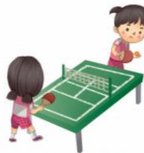
ปิงปอง 桌球