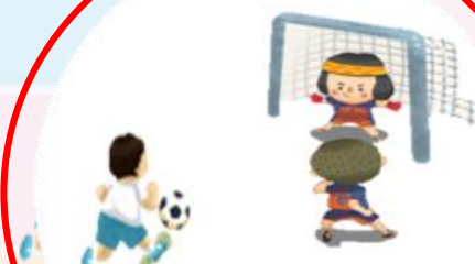
เตะฟุตบอล 足球