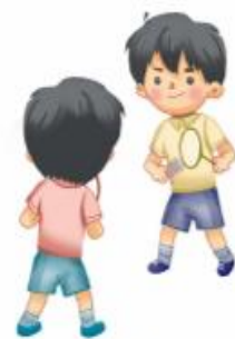
แบดมินตัน 羽毛球