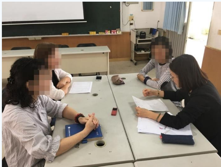
高雄市橋頭區甲圍國小跨國銜轉學生 華語文習得再訪會議 (108.03.18)