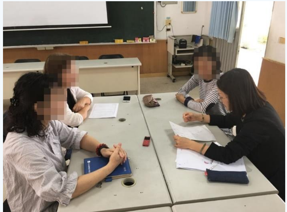
高雄市橋頭區甲圍國小跨國銜轉學生 華語文習得再訪會議 (108.03.18)